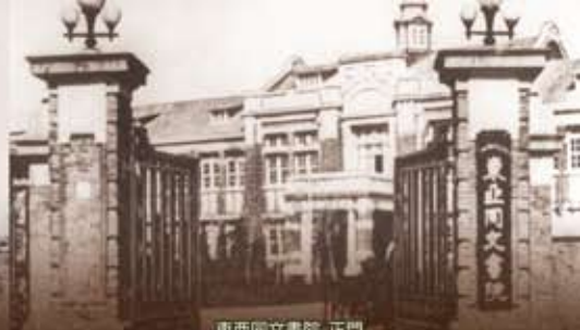
東亜同文書院 正門

国内シンポジウム 愛知大学東亜同文書院大学記念センター/オープン・リサーチ・センター