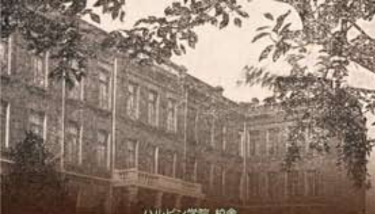
ハルビン学院 校舎