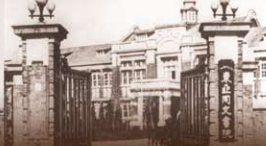
東亜同文書院 正門

国内シンポジウム 愛知大学東亜同文書院大学記念センター/オープン・リサーチ・センター