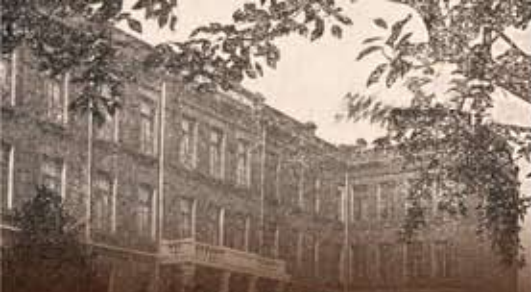
ハルビン学院 校舎