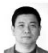
町田宗憲氏 (法政大学大学院国際文化研究科教授)